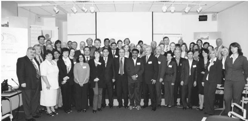
Учасники 40-ї конференції МК у Варшаві

Президент МК, доктор, професор Вольфганг Файгле представив перше число журналу ІС МК, а також інформацію про тематику, склад редколегії та вигоди щодо оформлення статей.