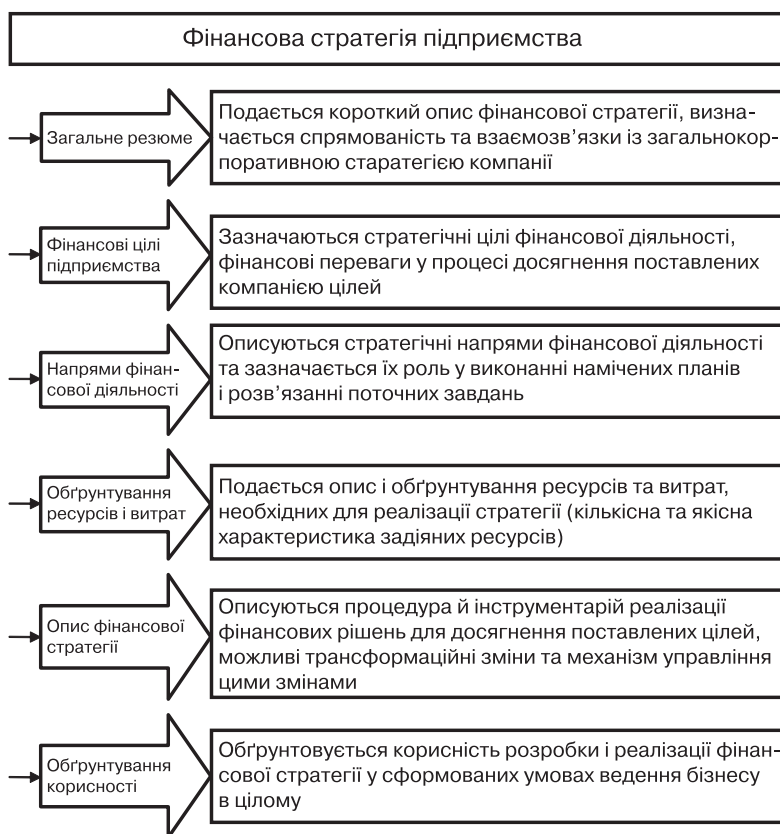
Загальний механізм формування фінансової стратегії

На основі отриманих результатів здійснюється комплексна оцінка існуючої фінансової позиції підприємства. В процесі такої оцінки потрібно отримати чітке уявлення про основні па-