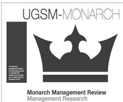
Рис. 1. Логотип журналу «Monarch Management Review Journal» Університету післядипломної освіти у сфері менеджменту «Бізнес-школа Монарх»

— надання можливості науковцям та студентам Монарху, рівно як і представникам наукового середовища та професіоналам інших установ, можливості публікувати свої роботи, які сприятимуть набуттю