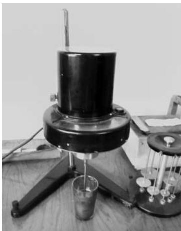
Рис. 1. Віскозиметр Брукфілда

ся осторонь проблем підготовки фахівців і із ентузіазмом приймають студентів, проводять екскурсії по підприємствах, знайомлять із практичними аспектами виробництва, а також надають виробничі потужності, технічні засоби для проведення експериментальних досліджень, що сприяє завершенню магістерських про-