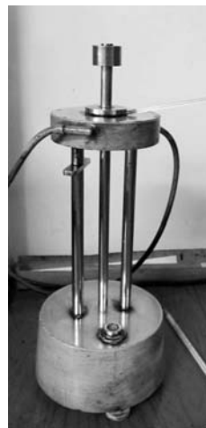
Рис. 2. Віскозиметр Ларєя