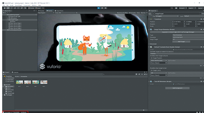
Рис. 1. Тестування додатку вебкамерою ноутбука

На зображення, які виступають в ролі таргетів, накладається ряд визначених вимог: